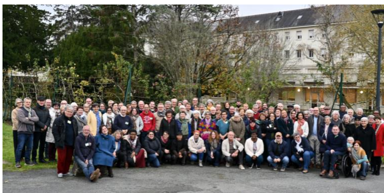
Les délégués synodaux de la région Ouest