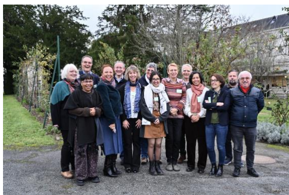
Les délégués du consistoire Centre-Loire

Pour en savoir plus sur ce qu'il s'est vécu durant ce Synode rendez-vous sur le site de la région Ouest : https://region-ouest.epudf.org/Newsletter/%f0%9f%91%89-le-synode-de-la-region-ouest-2025/