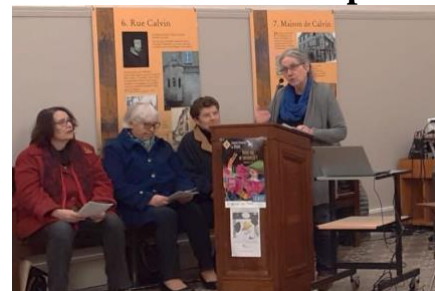
Vendredi 3 mars au temple