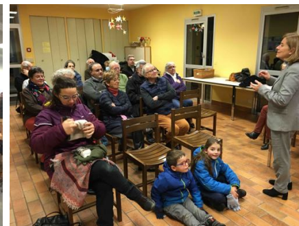
Présentation en diapo le 7 décembre