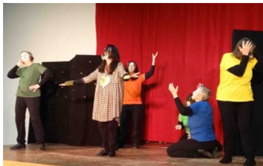
Avec la participation des Ambassadeurs