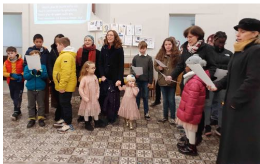
Participation des écoles bibliques au culte,