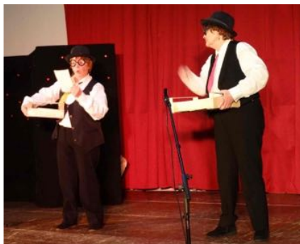
Avec la troupe d'Angers « Les Ambassadeurs »