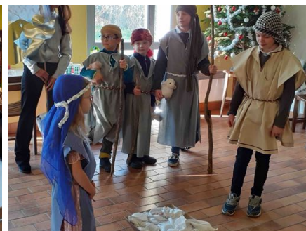
et animations l'après-midi