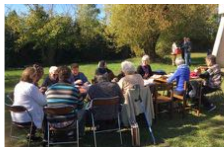
et le groupe catéchétique des adultes l'après-midi.