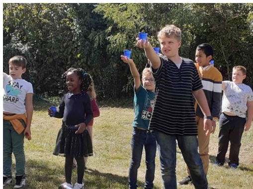
L'animation de l'après-midi pour les enfants