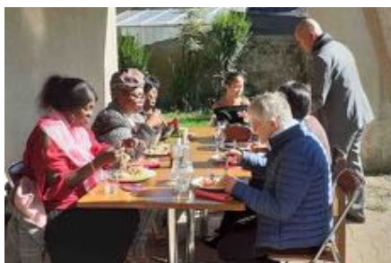
le repas à La Chaume,