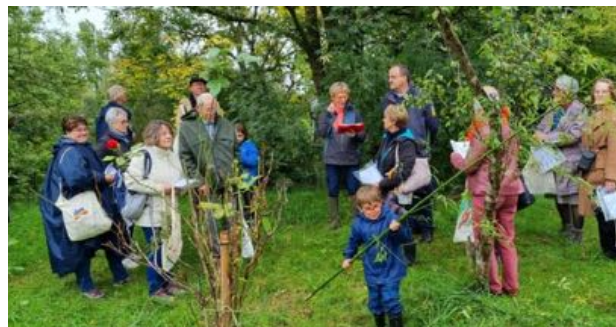
Une quinzaine de personnes ont suivi sous la pluie et avec le sourire la marche méditative dans les marais de Bourges.