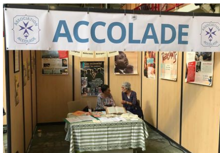
Accolade et l'Église tenaient un stand commun