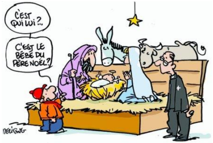
Une des nouvelles mesures pour les lieux de cultes