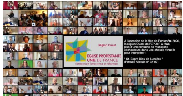
La chorale virtuelle de Pentecôte.

C'est très simple : vous allez trouver ici le mode d'emploi, la partition de musique, Réjouis-toi, voici ton Roi , et les bandes sons à écouter pour apprendre les voix, les chanter ou/et les jouer.