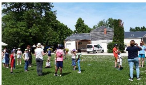
Constitution des équipes pour le grand jeu de la Création