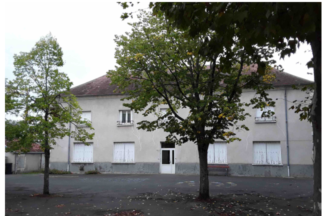
L'école élémentaire Jacques Prévert, place du 14 juillet à Asnières-lès-Bourges.

La municipalité se défend : c'est elle-même, dit-elle, qui a édifié le bâtiment. Cela sans preuves, et elle ne veut rien rembourser. Or, grâce aux comptes rendus des Conseils presbytéraux, il est établi que seuls les protestants ont bâti et payé la quasi intégralité du bâtiment. Le Consistoire a eu