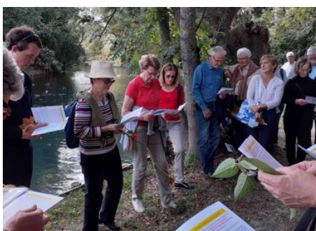
Un parcours biblique dans les marais a été suivi d'une célébration à l'église St-Bonnet