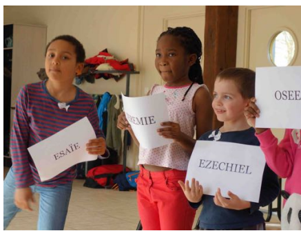
Découvrir le prophète Jonas parmi les autres prophètes.