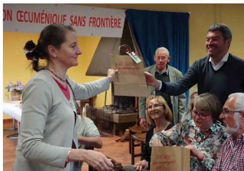
Accueil à La Chaume et distribution des cadeaux, le vendredi soir.