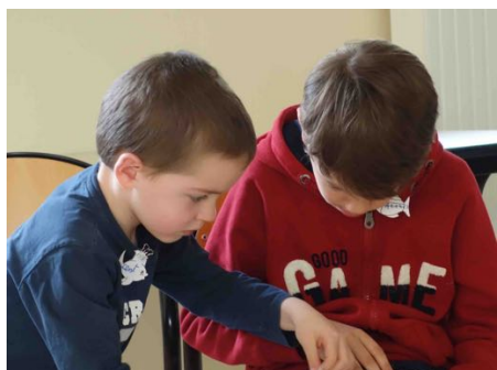
Chercher le prophète Jonas dans la Bible...

Les 7 et 8 avril derniers, 22 enfants de Tours, Bourges et Orléans se sont retrouvés à Chateau pour vivre un week-end avec Jonas qui signifie « colombe »... Deux journées riches en jeux, bricolages, rencontres et moments spirituels, bien servies par une météo fort agréable, qui ont permis aux enfants d'entendre la totalité de l'histoire de Jonas, et de réfléchir à ce qu'elle avait à nous dire !