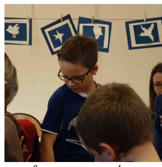
Les enfants ont pu créer une carte postale qui évoque Jonas en tant qu'envoyé de Dieu.