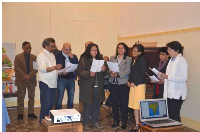
Des chants et un buffet de spécialités malgaches ont agrémenté cette belle soirée.