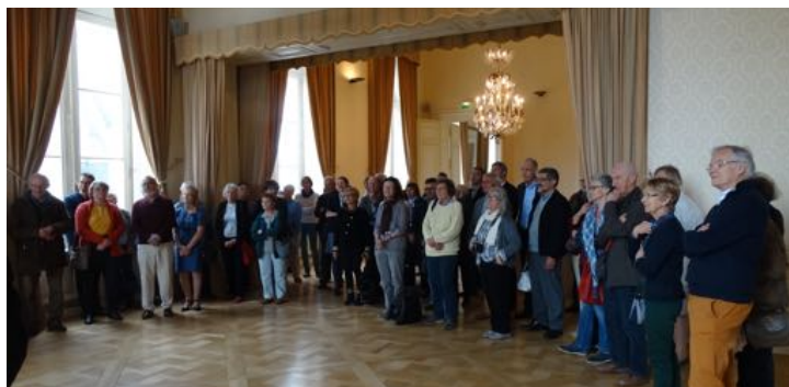
Réception par la municipalité à l'Hôtel de ville, le samedi matin.