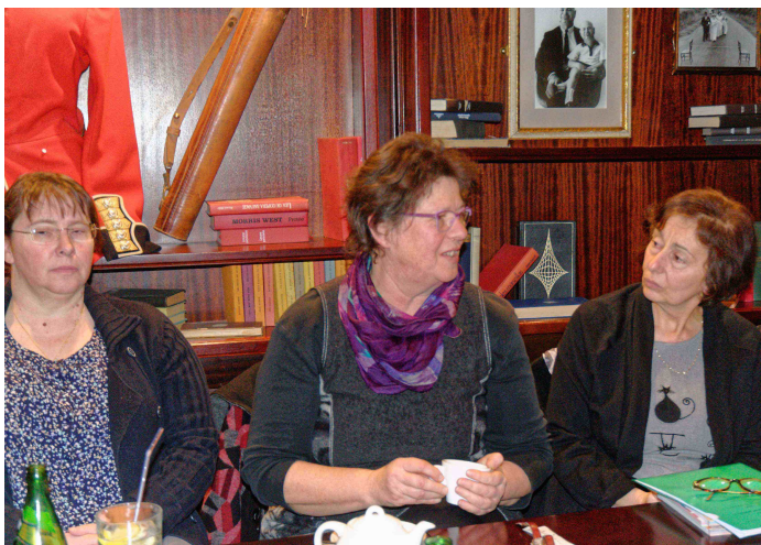
Café citoyen Vierzon avec d'autres actrices de la vie publique