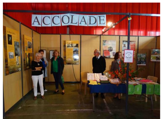
Le stand d'Accolade et de l'Église