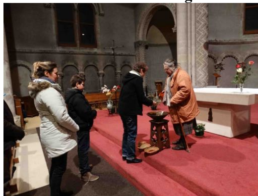
Jésus dit à la femme : Donne-moi à boire

Le 23 janvier à la chapelle des sœurs Marie immaculée à Bourges