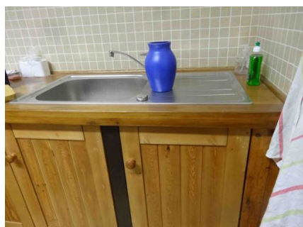
Pour le confort des uns et...