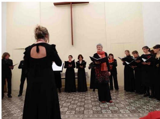
Voyage au cœur du son