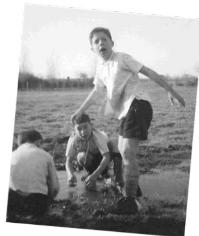
Les louveteaux d'Asnières dans les années 60