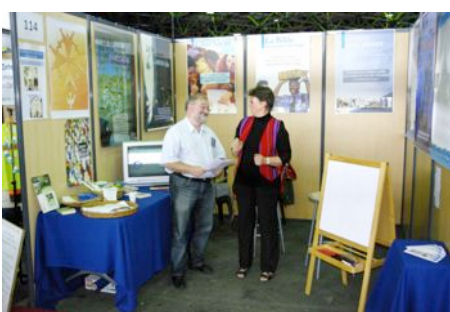
Visite conviviale du curé au stand de notre église.