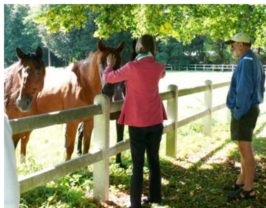
Trois pur-sang, en silence, se sont joints au groupe.