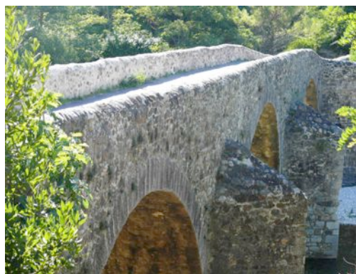
Le pont des camisards.