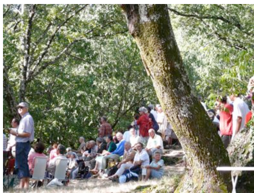
Quinze mille protestants étaient rassemblés.

liberté de conscience. Lorsqu'il y a conflit entre un ordre donné, par le pouvoir temporel (le roi, la force publique), et un ordre supérieur (venu de Dieu et ressenti comme tel en son âme et conscience), désobéir au premier est un devoir, non par principe d'anarchie, mais pour obéir au second.