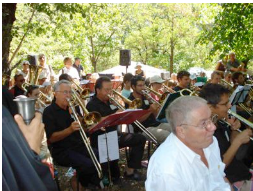
Un culte riche en lumière et en musique.