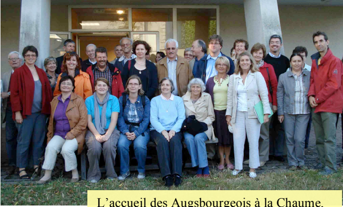
L'accueil des Augsbourgeois à la Chaume, le soir de leur arrivée.

Quatre jours intenses et riches en partage ont été vécus par les communautés protestante et catholiques de Bourges.