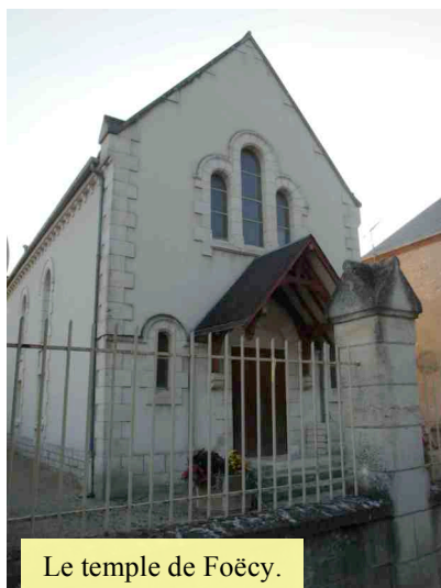
Le temple de Foëcy.